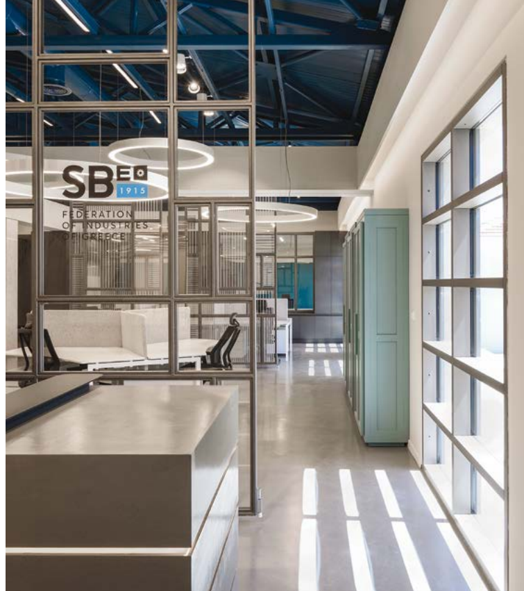
ΣΗΜΕΙΟ ΑΝΑΦΟΡΑΣ ΑΠΟΤΕΛΕΙ Η ΕΜΦΑΝΗΣ ΜΕΤΑΛΛΙΚΗ ΟΡΟΦΗ ΣΕ ΜΠΛΕ ΧΡΩΜΑ, ΠΟΥ ΔΙΑΤΡΕΧΕΙ ΤΟ ΕΠΙΜΗΚΕΣ ΚΤΙΡΙΟ ΚΑΙ ΣΥΝΔΕΕΙ ΤΙΣ ΕΠΙ ΜΕΡΟΥΣ ΕΝΟΤΗΤΕΣ.