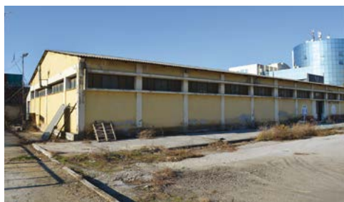
ΤΟ ΚΤΙΡΙΟ ΗΤΑΝ ΚΑΤΑΣΚΕΥΑΣΜΕΝΟ ΜΕ ΦΕΡΟΝΤΑ ΟΡΓΑΝΙΣΜΟ ΟΠΛΙΣΜΕΝΟΥ ΣΚΥΡΟΔΕΜΑΤΟΣ ΚΑΙ ΜΕΤΑΛΛΙΚΗ ΔΙΡΙΧΤΗ ΣΤΕΓΗ.

Η ΜΕΤΕΓΚΑΤΑΣΤΑΣΗ ΤΟΥ ΣΥΝΔΕΣΜΟΥ ΒΙΟΜΗΧΑΝΙΩΝ ΕΛΛΑΔΑΣ ΑΠΟ ΜΙΑ ΑΠΡΟΣΩΠΗ ΠΟΛΥΚΑΤΟΙΚΙΑ, ΣΤΗΝ ΠΕΡΙΟΧΗ ΤΩΝ ΛΑΔΑΔΙΚΩΝ ΤΗΣ ΘΕΣΣΑΛΟΝΙΚΗΣ ΣΕ ΑΥΤΟΝΟΜΟ ΚΑΙ ΑΝΑΚΑΙΝΙΣΜΕΝΟ ΒΙΟΜΗΧΑΝΙΚΟ ΚΤΙΡΙΟ ΣΤΟΝ ΑΝΑΠΤΥΣΣΟΜΕΝΟ ΔΥΤΙΚΟ ΤΟΜΕΑ ΤΗΣ ΠΟΛΗΣ ΙΣΩΣ ΣΗΜΑΤΟΔΟΤΕΙ ΤΗΝ ΤΑΣΗ ΕΝΕΡΓΟΠΟΙΗΣΗΣ ΤΗΣ ΟΙΚΟΝΟΜΙΚΗΣ ΚΟΙΝΟΤΗΤΑΣ ΤΗΣ ΠΕΡΙΟΧΗΣ, ΠΟΥ ΚΑΠΟΤΕ ΗΤΑΝ ΣΤΟ ΕΠΙΚΕΝΤΡΟ ΤΗΣ ΟΙΚΟΝΟΜΙΑΣ ΤΗΣ ΧΩΡΑΣ ΚΑΙ ΤΩΝ ΒΑΛΚΑΝΙΩΝ.