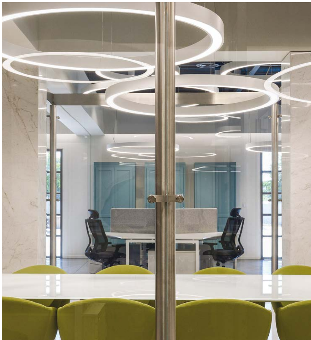
ΣΤΟ ΚΕΝΤΡΟ ΤΟΥ ΕΡΓΑΣΙΑΚΟΥ ΧΩΡΟΥ ΤΟΠΟΘΕΤΕΙΤΑΙ Η ΑΙΘΟΥΣΑ ΣΥΝΕΔΡΙΑΣΕΩΝ, Η ΟΠΟΙΑ ΟΡΙΖΕΤΑΙ ΑΠΟ ΚΡΥΣΤΑΛΛΙΝΑ ΠΙΕΤΑΣΜΑΤΑ.

Σημείωση "ΚΤΙΡΙΟ": Λόγω του ιδιαίτερου επιχειρηματικού ενδιαφέροντος του κτιρίου και της μεθόδου αυτοχρηματοδότησής του αποκλειστικά από τα μέλη του Σ.Β.Ε., κρίνεται αναγκαίο να αναφερθούν οι σημαντικότεροι χορηγοί, που ανήκουν στο χώρο των κατασκευών. ALUMIL, KLEEMAN, ISOMAT, HELLENIC PETROLEUM, DELOITTE, BIOSOLIDS, DOMOLAM, PAVLIDIS, ΗΡΑΚΛΗΣ, OLYMPIQ ELECTRONICS, TITAN, KEBE, LOGISMOS, MAKIOS.