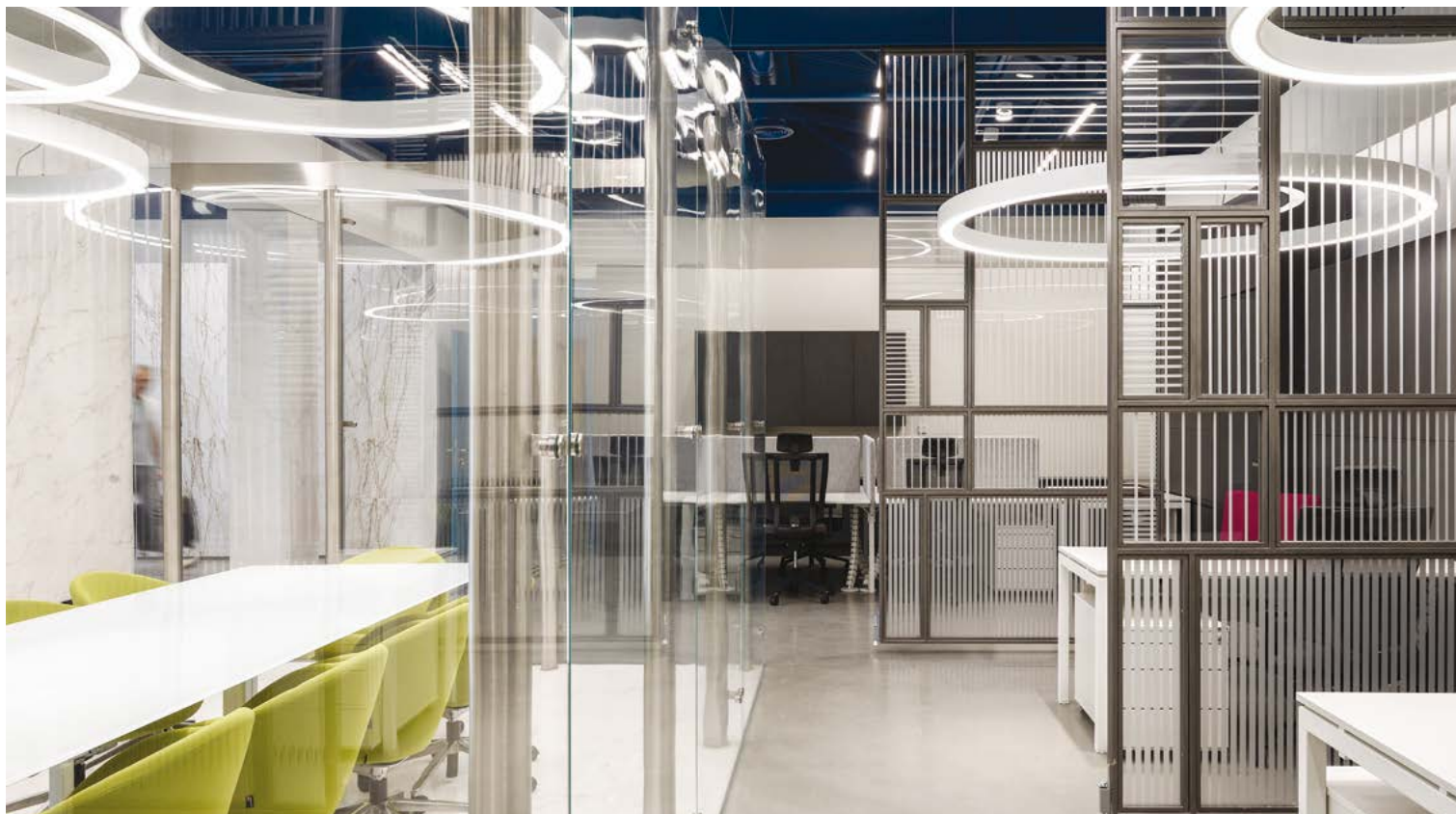
ΟΙ ΚΥΚΛΙΚΕΣ ΔΙΑΤΟΜΕΣ ΤΩΝ ΦΩΤΙΣΤΙΚΩΝ ΣΕ ΔΙΑΦΟΡΕΣ ΔΙΑΜΕΤΡΟΥΣ ΚΑΙ ΎΨΗ ΕΝΔΥΝΑΜΩΝΟΥΝ ΤΗΝ ΑΠΛΟΤΗΤΑ ΤΗΣ ΓΕΩΜΕΤΡΙΑΣ.

εργασίας αποτελεί αναπόσπαστο τμήμα της οροφής, στην οποία και εντάσσεται, ακολουθώντας τη γεωμετρία της. Οι κυκλικές διατομές σε διάφορες διαμέτρους και ύψη στο κέντρο του χώρου, ενδυναμώνουν την απλότητα της γεωμετρίας, εισάγοντας ένα στοιχείο ελεύθερης ροής και οργάνωσης. Στην αίθουσα πολλαπλών χρήσεων ο φωτισμός, μέσα από τις διαφορετικές κατασκευές της οροφής, αποτελεί το κεντρικό θέμα του χώρου, ενώ στο εντευκτήριο η γενναία κίνηση της οροφής από καθρέπτη στο μπαρ, που φέρει και το φωτισμό, έρχεται σε αντίστιξη με τη λιπότητα των αναρτημένων φωτιστικών σωμάτων στο χώρο του εστιατορίου. Τα επί μέρους τμήματα υπακούουν στο γενικό σχεδιασμό, που διατρέχει το σύνολο, διατηρώντας την αυτονομία τους μέσα από επί μέρους σχεδιαστικούς χειρισμούς. Η γεωμετρία, τα υλικά και το χρώμα συνδυάζονται και συνυπάρχουν αρμονικά, δημιουργώντας ένα χώρο στιβαρό με σημεία ενδιαφέροντος και "εκπλήξεις", ανάλογο του σημαντικού θεσμού που αντιπροσωπεύει.