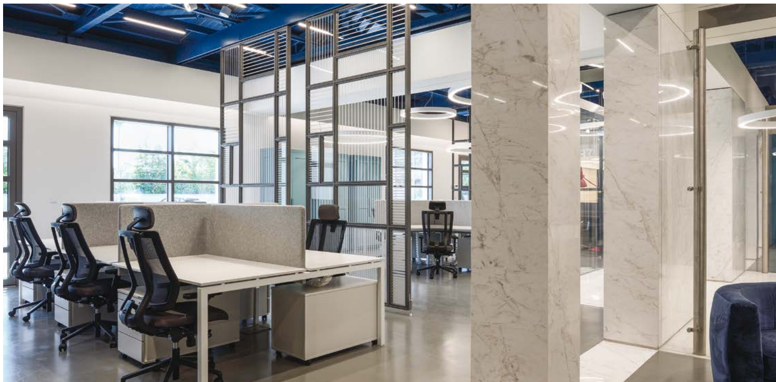
ΟΙ "ΑΝΟΙΧΤΕΣ" ΘΕΣΕΙΣ ΕΡΓΑΣΙΑΣ ΕΙΝΑΙ ΟΜΑΔΟΠΟΙΗΜΕΝΟΙ ΣΤΑΘΜΟΙ ΑΝΑ ΤΟΜΕΑ ΚΑΙ ΛΕΙΤΟΥΡΓΙΑ.