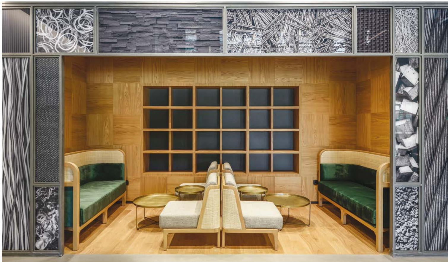
Ο ΧΩΡΟΣ ΤΗΣ ΒΙΒΛΙΟΘΗΚΗΣ - ΚΑΘΙΣΤΙΚΟΥ ΟΡΓΑΝΩΝΕΤΑΙ ΜΕ ΕΜΦΑΣΗ ΣΤΙΣ ΞΥΛΙΝΕΣ ΕΠΙΦΑΝΕΙΕΣ.