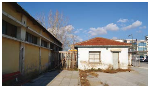
ΤΟ ΚΤΙΡΙΟ Β' ΘΑ ΛΕΙΤΟΥΡΓΗΣΕΙ ΩΣ ΧΩΡΟΣ ΓΡΑΦΕΙΟΥ ΚΑΙ ΦΥΛΑΚΙΟΥ ΑΣΦΑΛΕΙΑΣ.

Αποφασίσθηκε η εξ ολοκλήρου ανακατασκευή του κτιρίου, καθώς από το παλιό κτίριο παρέμεινε μόνον ο αρχικός σκελε-