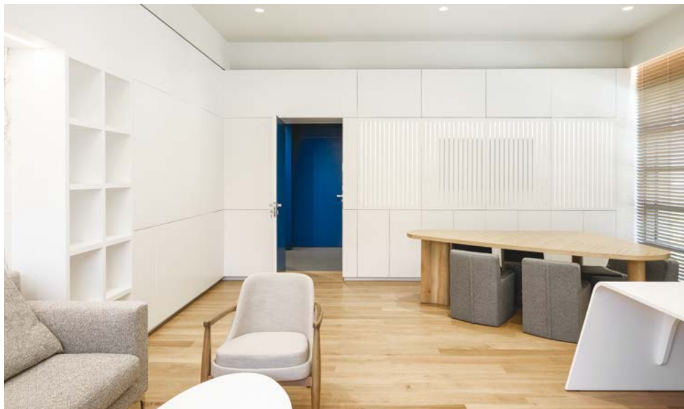
ΤΑ ΓΡΑΦΕΙΑ ΤΗΣ ΔΙΟΙΚΗΣΗΣ ΕΙΝΑΙ ΣΧΕΔΙΑΣΜΕΝΑ ΜΕ ΠΝΕΥΜΑ ΛΙΤΗΣ ΠΟΛΥΤΕΛΕΙΑΣ.