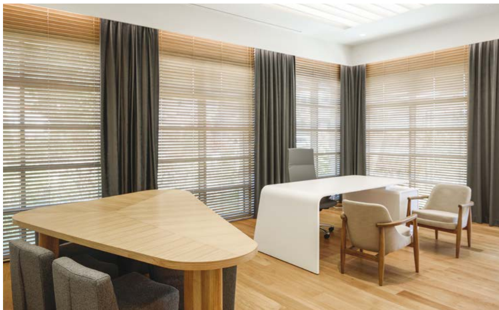
ΤΑ ΜΕΓΑΛΑ ΑΝΟΙΓΜΑΤΑ ΠΡΟΣΦΕΡΟΥΝ ΑΠΛΕΤΟ ΦΥΣΙΚΟ ΦΩΤΙΣΜΟ.