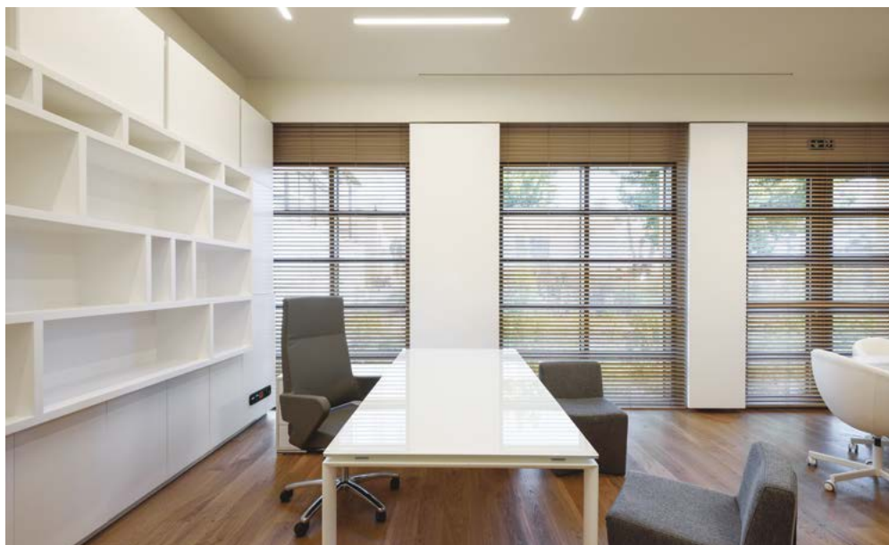
ΟΙ ΔΙΟΙΚΗΤΙΚΟΙ ΧΩΡΟΙ ΤΗΣ ΕΤΑΙΡΕΙΑΣ.

Ένα δεύτερο κτίριο (το κτίριο Β) θα λειτουργήσει ως χώρος γραφείου και φυλακίου ασφαλείας. Οι όψεις του έχουν επιχρισθεί και χρωματιστεί εκ νέου εξωτερικά αλλά και εσωτερικά.