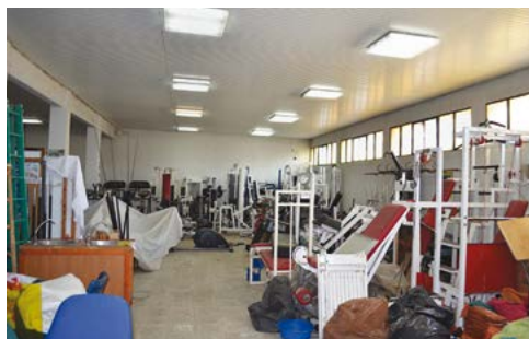
ΤΟ ΕΣΩΤΕΡΙΚΟ ΠΡΙΝ ΤΗΝ ΑΠΟΚΑΤΑΣΤΑΣΗ.

Η ΜΕΤΕΓΚΑΤΑΣΤΑΣΗ ΤΟΥ ΣΥΝΔΕΣΜΟΥ ΒΙΟΜΗΧΑΝΙΩΝ ΕΛΛΑΔΑΣ ΑΠΟ ΜΙΑ ΑΠΡΟΣΩΠΗ ΠΟΛΥΚΑΤΟΙΚΙΑ, ΣΤΗΝ ΠΕΡΙΟΧΗ ΤΩΝ ΛΑΔΑΔΙΚΩΝ ΤΗΣ ΘΕΣΣΑΛΟΝΙΚΗΣ ΣΕ ΑΥΤΟΝΟΜΟ ΚΑΙ ΑΝΑΚΑΙΝΙΣΜΕΝΟ ΒΙΟΜΗΧΑΝΙΚΟ ΚΤΙΡΙΟ ΣΤΟΝ ΑΝΑΠΤΥΣΣΟΜΕΝΟ ΔΥΤΙΚΟ ΤΟΜΕΑ ΤΗΣ ΠΟΛΗΣ ΙΣΩΣ ΣΗΜΑΤΟΔΟΤΕΙ ΤΗΝ ΤΑΣΗ ΕΝΕΡΓΟΠΟΙΗΣΗΣ ΤΗΣ ΟΙΚΟΝΟΜΙΚΗΣ ΚΟΙΝΟΤΗΤΑΣ ΤΗΣ ΠΕΡΙΟΧΗΣ, ΠΟΥ ΚΑΠΟΤΕ ΗΤΑΝ ΣΤΟ ΕΠΙΚΕΝΤΡΟ ΤΗΣ ΟΙΚΟΝΟΜΙΑΣ ΤΗΣ ΧΩΡΑΣ ΚΑΙ ΤΩΝ ΒΑΛΚΑΝΙΩΝ.