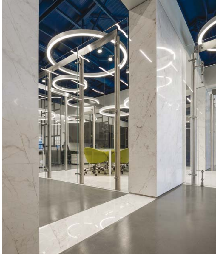
Ο ΚΕΝΤΡΙΚΟΣ ΑΞΟΝΑΣ ΤΟΥ ΚΤΙΡΙΟΥ ΣΗΜΑΙΝΕΤΑΙ ΜΕ ΜΑΡΜΑΡΙΝΕΣ ΠΑΡΑΣΤΑΔΕΣ.